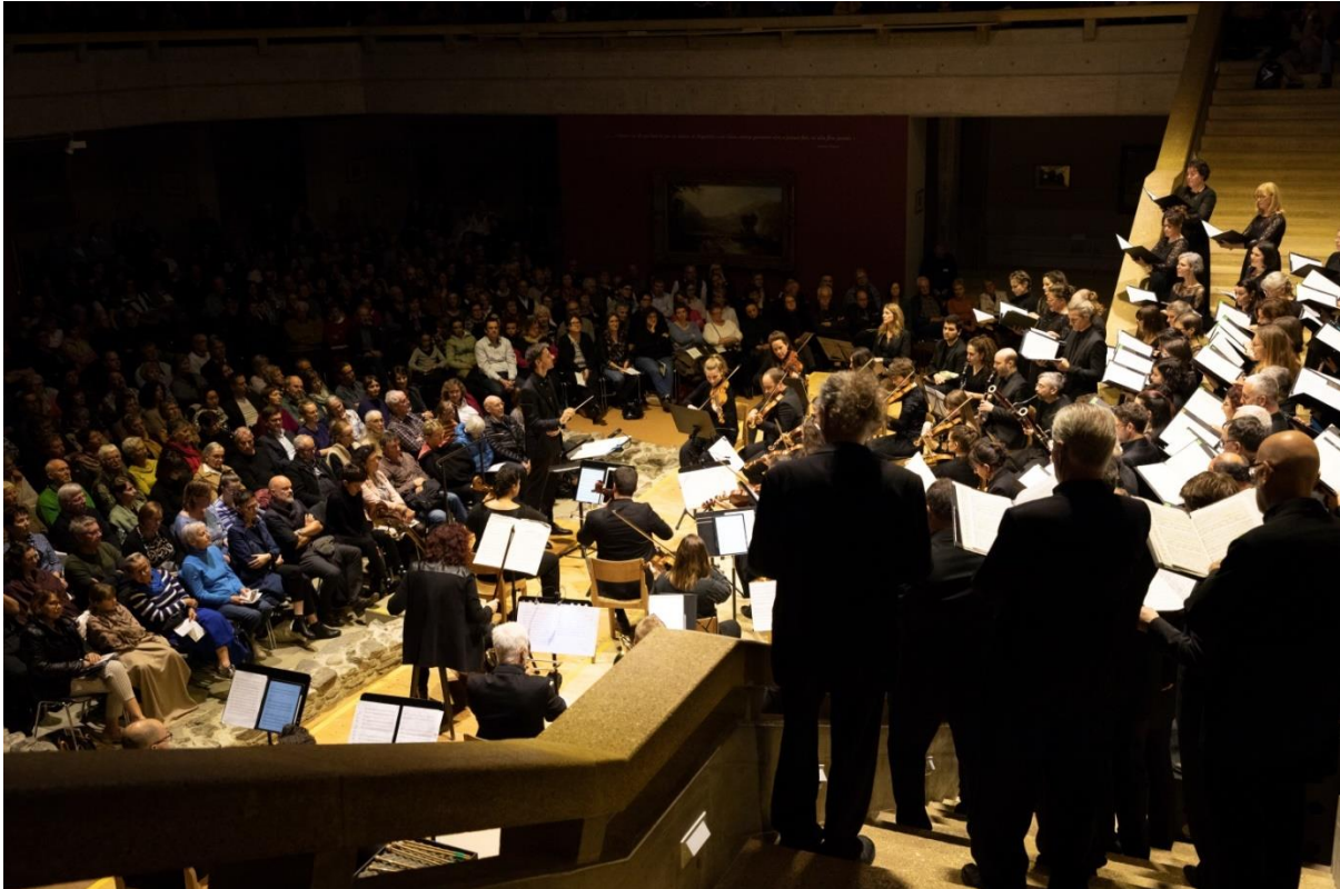
Konzert Fondation Gianadda