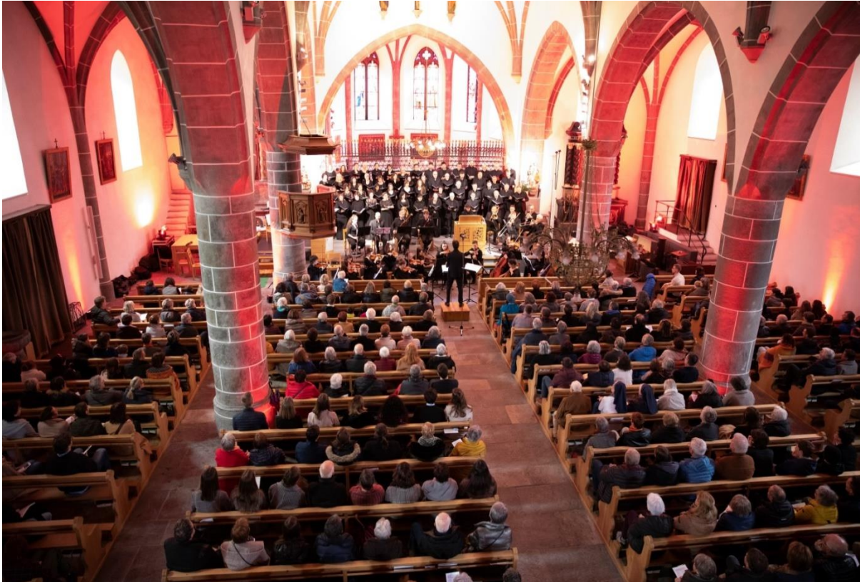
Konzert in Le Châble