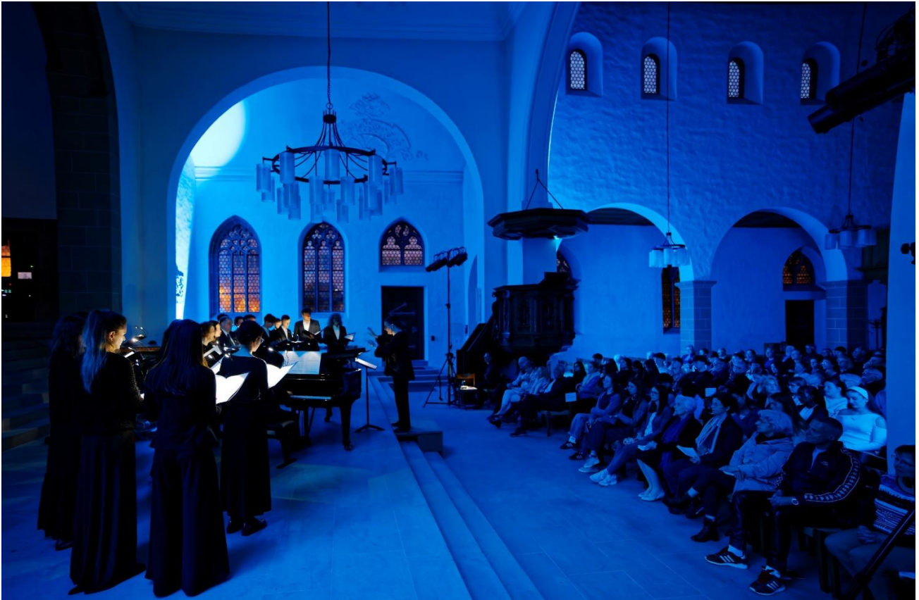
Lichtregie Herbert Bättig